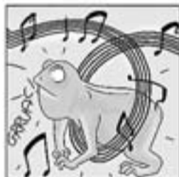
26. I fa gresca i fa sarau tot cantant "El gripau blau".