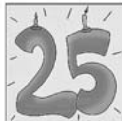
48. Ara fa 25 anys, fem-ne memòria, companys.