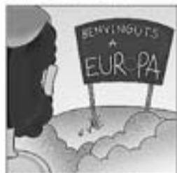
33. Torna, i passa per Europa cantant per un plat de sopa.