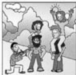
25. Amb els "Ara va de bo" en Xesco té un altre so.