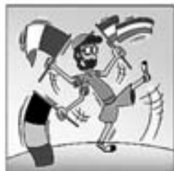
45. Va de Funa a l'altra banda Bèlgica, Itàlia i Holanda.