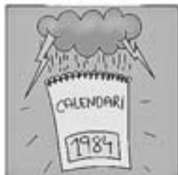
46. Fins que l'any 84 una depressió el va abatre.