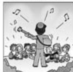
24. I canta per als petits que escolten embadalits.