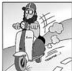
28. Viatjant amb la Lambretta, amb què fa vols d'oreneta.