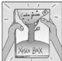
40. I fa un llibre preciós que es diu «L'arbre generós».