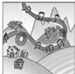
27. Fa recerca de cançons i arriba per mil racons.