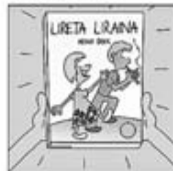
42. I un més, «Lireta lirana», que és un llibre, una moixaina.