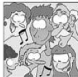
30. Que fa conèixer als infants i que encanten els més grans.