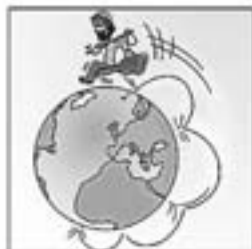
44. Cantant com un rodamón en Xesco corre pel món.