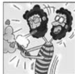
29. Com un nou Joan Amades recull cançons rovellades.