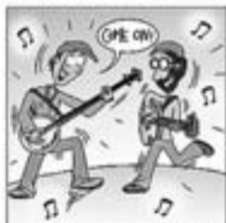
31. Amb Pete Seeger, dia i nits, passa un temps a Estats Units.