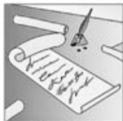
15. ... d'on en sortirà fixat per ser un home revoltat.