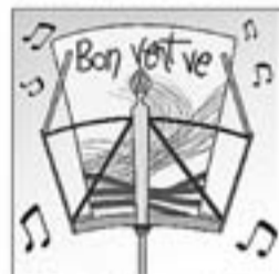
35. El seu primer cançoner que publica és «Bon vent ve».