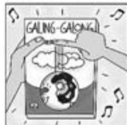
41. També treu «Galing-galongi» amb cert regust de folk-song.