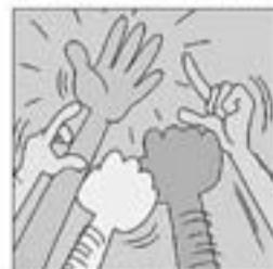
36. Amb "Els cinc dits d'una mà" fa pinya per actuar.